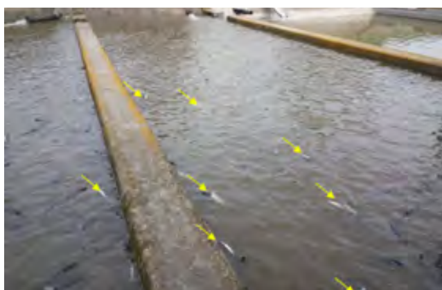
Scarico a fine trasporto, con elevata mortalità di pesci

Qualora i pesci non vadano direttamente al macello, devono essere fatti obbligatoriamente riposare per un tempo di almeno una settimana prima di effettuare un ulteriore trasporto.