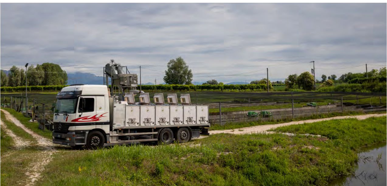
Particolare dei contenitori di carico e relative aperture superiori per il carico e l'ispezione