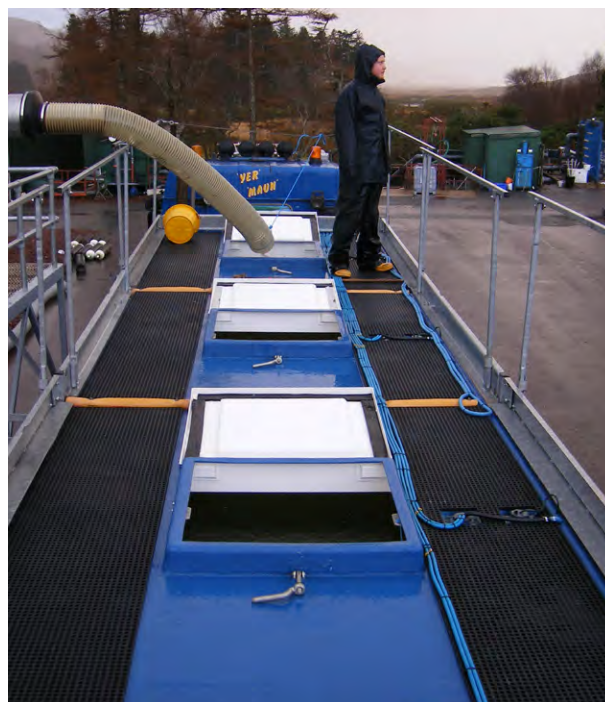
Attrezzature utilizzate per il carico del pesce