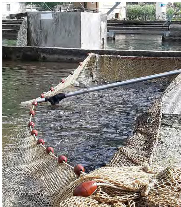
Posizionamento delle reti in vasca e raggruppamento del pesce per la cattura